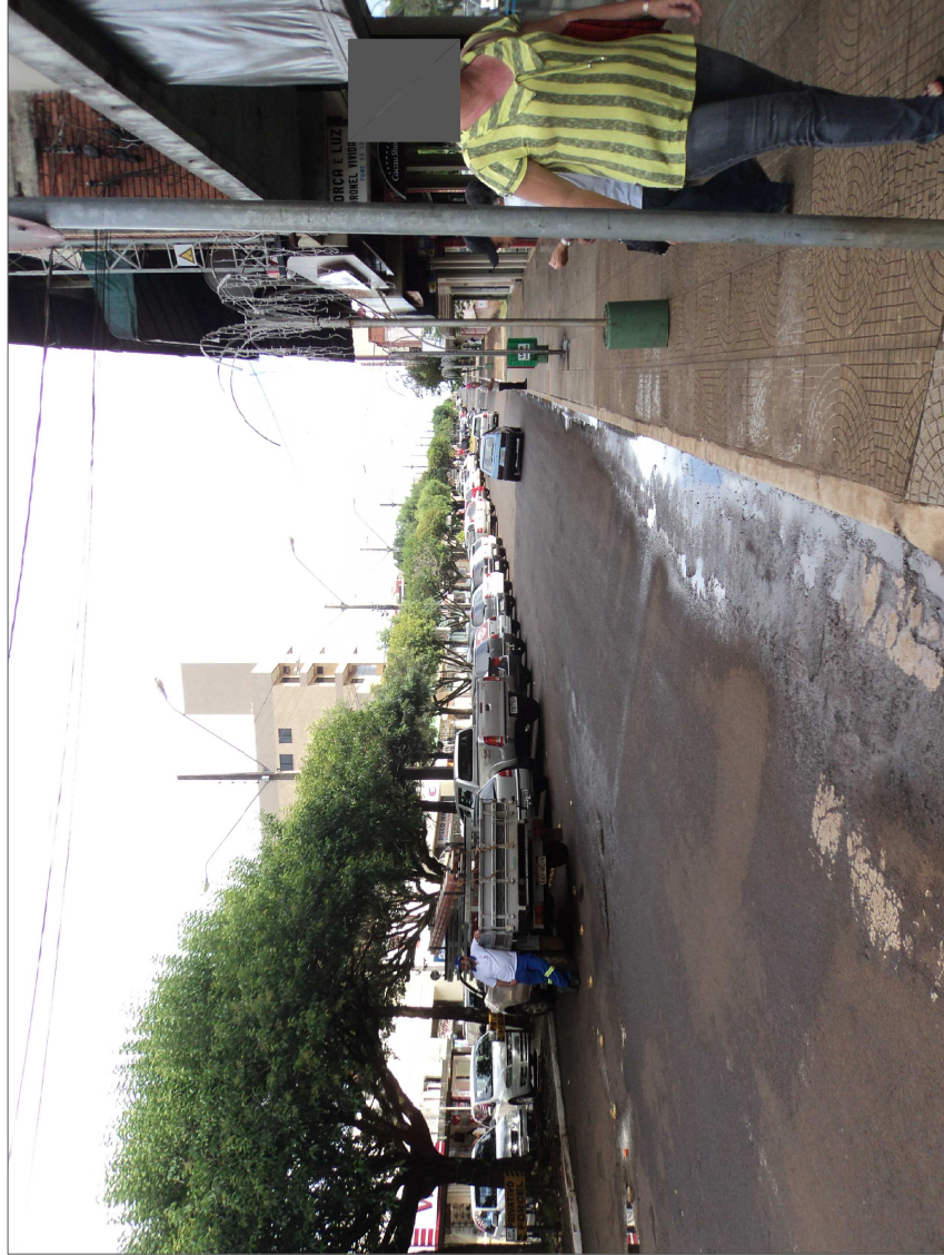
Sentido saída para Chopinzinho